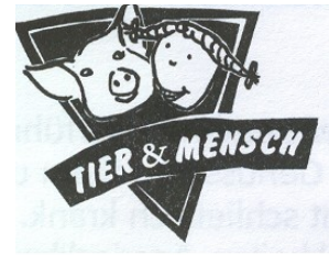
Tier & Mensch